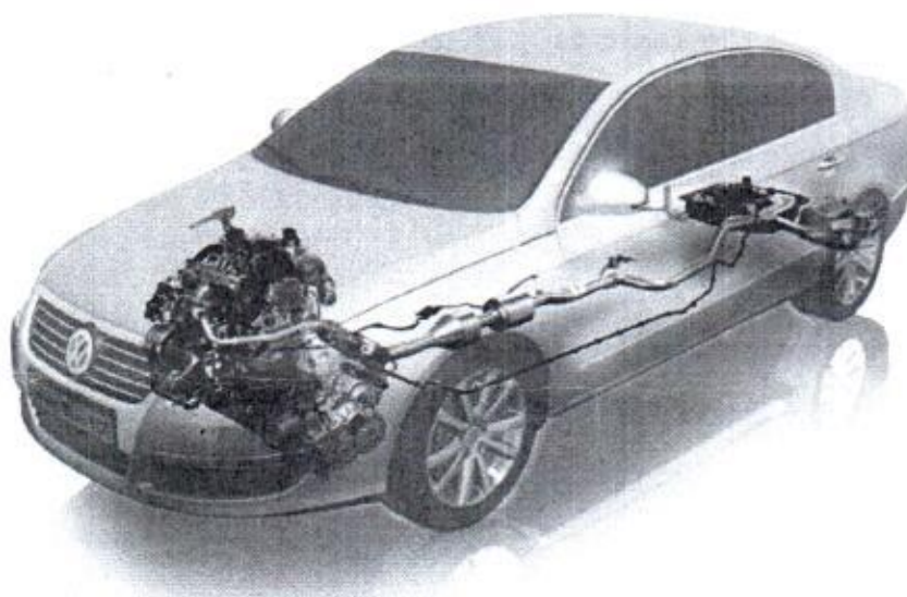
Rozmieszczenie elementów systemu redukującego tlenki azotu NOx w nadwoziu

Opisany sposób uzupełnienia wyposażenia samochodu pozwala na utrzymanie parametrów trakcyjno-eksploatacyjnych pojazdu (zużycie paliwa i moment obrotowy silnika) przy jednoczesnym spełnieniu norm dotyczących norm toksyczności spalin.